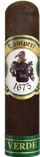
Oval Short Robusto 4 x 54