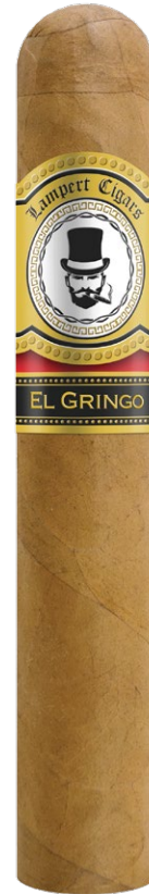
Robusto 5 x 50