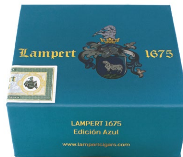
Travel box Short Robusto