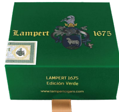
Travel box Oval Short Robusto