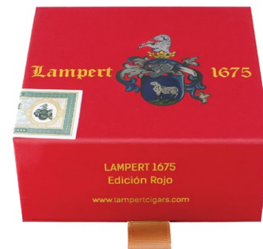
Travel box Short Robusto