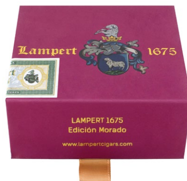
Travel box Short Robusto