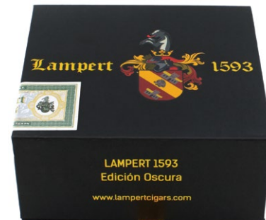
Travel box Short Robusto