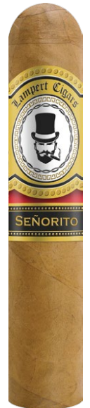
Half Corona 3 1/2 x 44