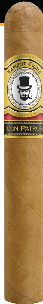
Toro 6 x 52