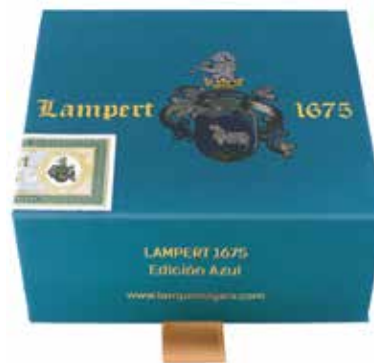
Travel box Short Robusto