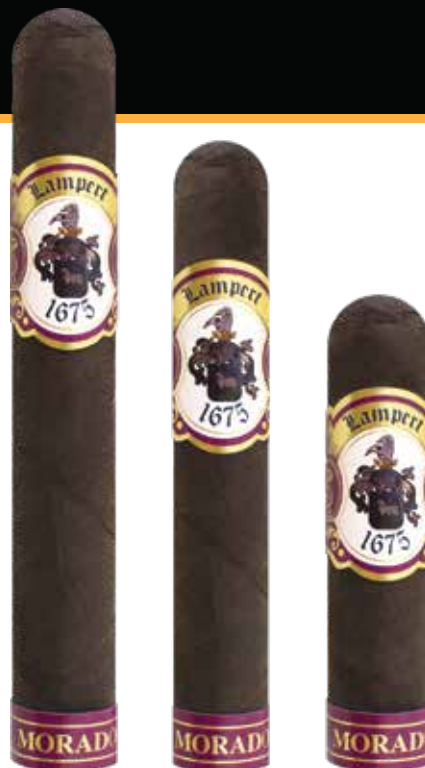
Toro 6 x 52