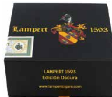
Travel box Short Robusto