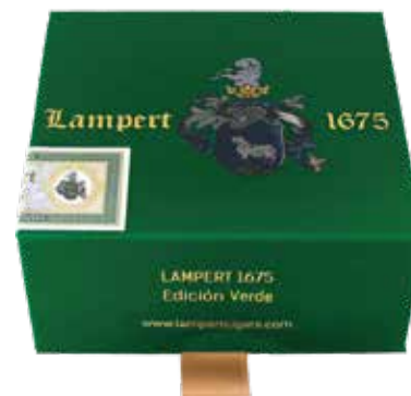
Travel box Oval Short Robusto