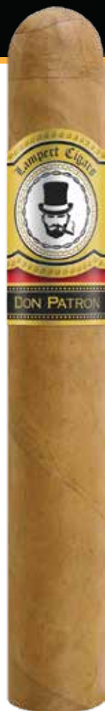
Toro 6 x 52