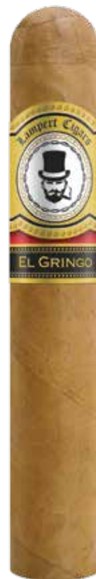
Robusto 5 x 50