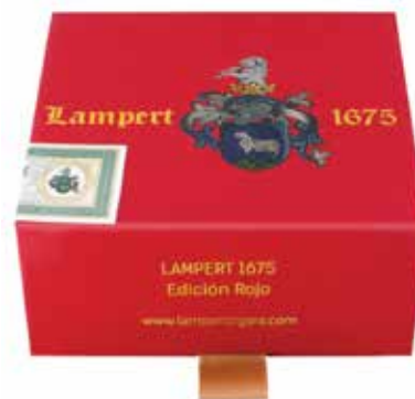
Travel box Short Robusto