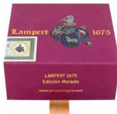
Travel box Short Robusto